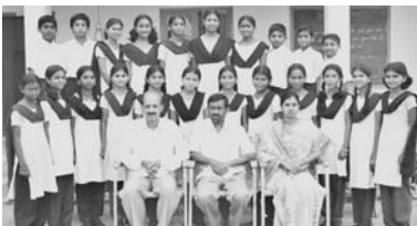
ಇತ್ತೀಚೆಗೆ ನಡೆದ ಕೊಡಗು ಜಿಲ್ಲಾ ಮಟ್ಟದ ಪ್ರತಿಭಾ ಕಾರಂಜಿ ಸ್ಪರ್ಧೆಯಲ್ಲಿ ಜನಪದ ಸ್ವತಃ ಹಾಗೂ ಕೋಲಾಟ ವಿಭಾಗದಲ್ಲಿ ರಾಜ್ಯಮಟ್ಟಕ್ಕೆ ಆಯ್ಕೆಯಾದ ಸರಕಾರಿ ಸಂಯುಕ್ತ ಪ್ರೌಢಶಾಲೆ ಕೆ.ಬಿ.ಎಂ.ಎಸ್. ಇಲ್ಲಿನ ವಿದ್ಯಾರ್ಥಿ ತಂಡ

ತುರ್ತು ಕರೆ: ಪೊಲೀಸ್ : 100 ಅಗ್ನಿ ಶಾಮಕ ದಳ : 101 ಆಂಬುಲೆನ್ಸ್ : 108 ಜಿಲ್ಲಾಧಿಕಾರಿ : 225500 ಪೊಲೀಸ್ ಅಧೀಕ್ಷಕರು : 229000 ಮೆಸಾಜ್ : 228454 ಕಾಪಿ ಮಂಡಳಿ : 225518 ಅರಣ್ಯ ಸಂರಕ್ಷಣಾಧಿಕಾರಿ : 225708 ಅಬಕಾರಿ : 225697 ಲೋಕೋಪಯೋಗಿ : 225645