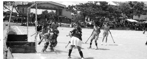
ಗೋಲು ಪಡೆಯಲು ಹಣಕಾಸಿನ ನಡೆಸುತ್ತಿರುವ ಸ್ಪರ್ಧಾಳುಗಳು

ಗೋಣಿಕೊಪ್ಪುಲು: ಜಿಲ್ಲಾ ಪದವಿ ಪೂರ್ವ ಮತ್ತು ವೃತ್ತಿ ಶಿಕ್ಷಣ ಇಲಾಖೆ ಹಾಗೂ ಗೋಣಿಕೊಪ್ಪು ಕಾವೇರಿ ಕಾಲೇಜು ಇವರುಗಳ ಸಂಯುಕ್ತಾಶ್ರಯದಲ್ಲಿ ಇಲ್ಲಿನ ಕಾವೇರಿ ಕಾಲೇಜು ಮೈದಾನ ಹಾಗೂ ಪೊನ್ನಂಪೇಟೆಯ ಸರಕಾರಿ ಪದವಿ ಪೂರ್ವ ಕಾಲೇಜು ಮೈದಾನದಲ್ಲಿ ನಡೆಯುತ್ತಿರುವ ರಾಜ್ಯ ಮಟ್ಟದ ಬಾಲಕ ಹಾಗೂ ಬಾಲಕಿಯರ ಹಾಕಿ ಪಂದ್ಯಾಟದಲ್ಲಿ ಕೊಡಗು ತಂಡ ಬೆಂಗಳೂರು ದಕ್ಷಿಣ ತಂಡದ ವಿರುದ್ಧ 4-0 ಗೋಲು ಗಳಿಸಿ ಸೆಮಿ ಫೈನಲ್ ಪ್ರವೇಶಿಸಿದರೆ, ಮೈಸೂರು ತಂಡ ಬೆಂಗಳೂರು ಉತ್ತರ ತಂಡವನ್ನು 2-0 ಗೋಲುಗಳಿಂದ ಮಣಿಸಿ ಸೆಮಿಫೈನಲ್‌ಗೆ ಅರ್ಹತೆ ಪಡೆದಿದೆ. ಬಾಗಲಕೋಟೆ ತಂಡ ಕೋಲಾರ ತಂಡವನ್ನು 3-0 ಗೋಲುಗಳಿಂದ, ದಾವಣಗೆರೆ ತಂಡ ಹಾಸನ ತಂಡವನ್ನು 4-3 ಗೋಲುಗಳಿಂದ ಮಣಿಸಿ ಸೆಮಿ ಫೈನಲ್ ಪ್ರವೇಶಿಸಿದರೆ ಬಾಲಕರ ವಿಭಾಗದಲ್ಲಿ ಬೆಂಗಳೂರು ದಕ್ಷಿಣ ತಂಡ ದಾರವಾಡ ತಂಡವನ್ನು 4-0 ಗೋಲುಗಳಿಂದ, ಬೆಂಗಳೂರು ಉತ್ತರ ತಂಡವನ್ನು 5-0 ಗೋಲುಗಳಿಂದ, ಬೆಂಗಳೂರು ಉತ್ತರ ತಂಡವನ್ನು 1-0 ಗೋಲುಗಳಿಂದ ಜಯಗಳಿಸಿ ಸೆಮಿ ಫೈನಲ್ ಪ್ರವೇಶಿಸಿದರೆ ಸಮಯದ ಅಭಾವದಿಂದ ಮಂಗಳೂರು ಹಾಗೂ ತುಮಕೂರು ನಡುವಿನ ಪಂದ್ಯ ತಾ.31 ರಂದು ನಡೆಯಲಿದ್ದು ಇದರಲ್ಲಿ ಜಯಗಳಿಸಿದ ತಂಡ ಸೆಮಿ ಫೈನಲ್ ಪ್ರವೇಶಿಸಲಿದೆ. ರಾಜ್ಯದ ವಿವಿಧೆಡೆಗಳಿಂದ ಬಾಲಕಿಯರ ವಿಭಾಗದಲ್ಲಿ 19 ತಂಡ