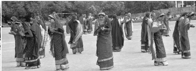
ಉದ್ಘಾಟನೆಗೆ ಮುನ್ನ ಕೊಡವ ಮಹಿಳೆಯರಿಂದ ಸಾಂಪ್ರದಾಯಿಕ ಉಮ್ಮತಾಳೆ ಪ್ರದರ್ಶನಗೊಂಡಿತು.